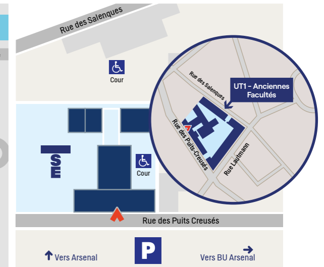
Campus des Anciennes Facultés 2ter, rue des Puits-Creusés 31000 Toulouse, Tél : 05 61 63 37