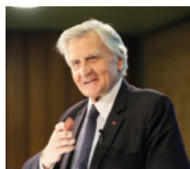
Jean-Claude Trichet Ex président BCE