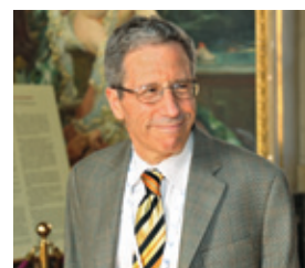
Eric Maskin Prix Nobel d'Économie