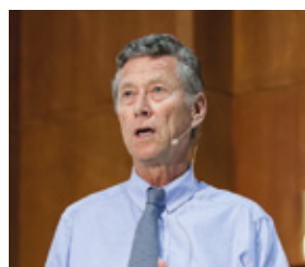
Olivier Blanchard Chef économiste - FMI

La qualité de la programmation a notamment permis à TSE d'attirer de grands noms à Toulouse :